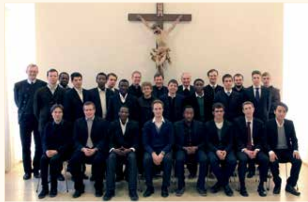
Vi.S.d.P.: Bischöfliches Seminar, Leonrodplatz 3, 85072 Eichstätt, Tel. 08421 50 300, E-Mail: bischoefliches.seminar@bistum-eichstaett.de Gestaltung: Stabstelle Medien und Öffentlichkeitsarbeit